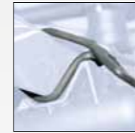
GOMMINO SALVA BICI RUBBER BIKE PROTECTOR