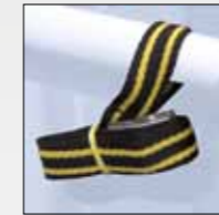
CINGHIA DI SICUREZZA SAFETY STRAP