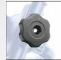
CHIUSURA CON POMELLO CLOSE-UP WITH KNOB