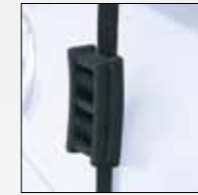
TENSORE ANTIDISTACCO BUMP ABSORBERS