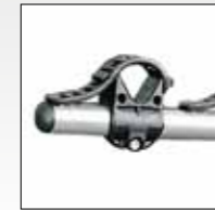
BLOCCAGGIO SINGOLO SINGLE BLOCKING