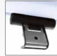
ADATTATORE BAULE IN VETRO GLASS HATCH ADAPTOR