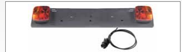
ART. 394 PORTATARGA COMPLETA DI FANALI E SPINA 7 POLI LUNGHEZZA CAVO: 1,5 MT NUMBER PLATE HOLDER COMPLETE WITH LIGHTS AND 7 PIN PLASTIC PLUG CABLE LENGTH: 1,5 MT