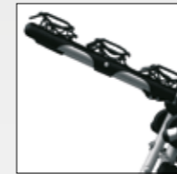
BLOCCAGGIO TRIPOLO TRIPLE BLOCKING