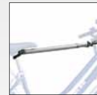
ART. 395 ADATTATORE DONNA/UOMO REMOVABLE CROSSBAR AVAILABLE SEPARATELY