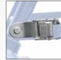
FIBBIA IN ACCIAIO STEEL BUCKLE